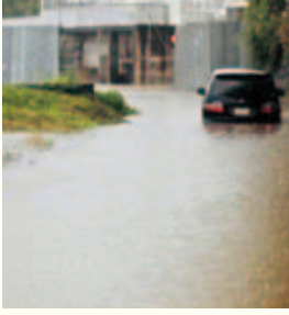
関東・東北豪雨 (平成27年9月)