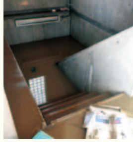
東日本台風 (令和元年10月)

近年、地球温暖化の影響などにより、集中豪雨や土砂災害などの災害リスクが高まっています。