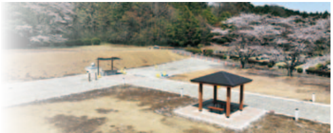
▲整備中の合葬墓の様子

少子高齢化の進行や単身世帯の増加により、「お墓を引き継ぐ人がいない」、「子どもにお墓の負担をかけたくない」などのニーズに応えるため、複数の遺骨を合同で埋蔵し、永代にわたり市が管理する合葬墓を、鹿沼市見笹霊園内に整備しました。