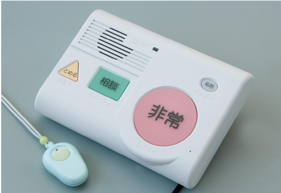
緊急通報装置(固定型)