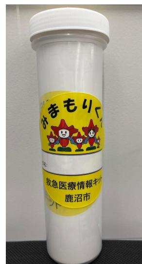
救急医療情報キット 縦:22cm 直径:6cm

対象要件などを確認し、利用できる人として認められる場合「救急医療情報キット」を給付します。