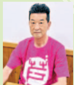
西大芦地区自治会協議会長

地域で協力して活動しています 西大芦地区では観光公害の解消に向け、地域が協力し清掃や啓発活動のほか路上駐車対策として臨時駐車場の運営などを行っています。また、サポーターの皆さんも毎年ごみ拾いに協力してくれています。 この取り組みは続けていくことが大切ですが、そのためにはさまざまな人たちとの連携が欠かせません。 大芦川の清流を守るため、皆さんの協力をお待ちしています。