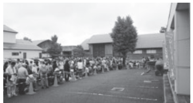
▲プレミアム商品券の販売

渋滞等の解消として、近隣の商業施設の駐車場が開店前であれば借用できるため、朝7時からの販売開始にしたと聞いています。第一弾の販売結果を受け、市としても混乱が生じないよう事前の申し込み制や抽選での実施等を鹿沼商工会議所に提案しましたが、最終的に鹿沼商工会議所が先着順と決定し販売したところ。です。