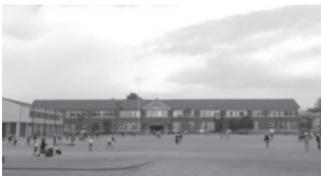
▲鹿沼市立北小学校