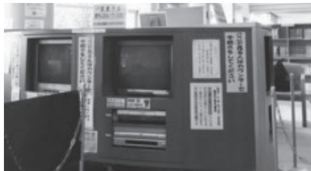
▲図書館(本館)視聴覚コーナー

調査を行いました。夜9時以降までの延長を希望した利用者は全体の6%にとどまりました。今後も夜9時までの開館時間間の延長は考えておりません。 座席数の増加や学習スペースの拡大は、本館・東分館とも所蔵本の増加により、新しくスペースを設けることは困難ですが、本館においては、利用者数が多くなる土・日・祝日は2階の学習席を開放し、学生等が集中して勉強できるよう学習環境の整備に努めています。今後、本館の視聴覚コーナーのリニューアルを行い、Wi-Fiの整備を検討していきたいと考えています。