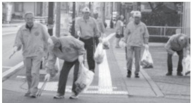
▲秋祭り翌日の一斉清掃（きれいなまちづくり推進員）

必要と考えます。なお、9月・10月のごみ焼却炉の完全停止期間中は、前年比で36%の減量をすることができました。市民の皆様一人一人がごみ減量の意識を高めていただければ、必ずごみ減量は可能であると確信しています。 特に、きれいなまちづくり推進員は、「きれいなまちづくり推進条例」に定める環境美化の促進等にご尽力をいただいています。また廃棄物減量等推進員を兼ねており、自治会内でのごみ分別や減量のための推進役であるため、連携してごみ減量を推進していきたいと考えています。