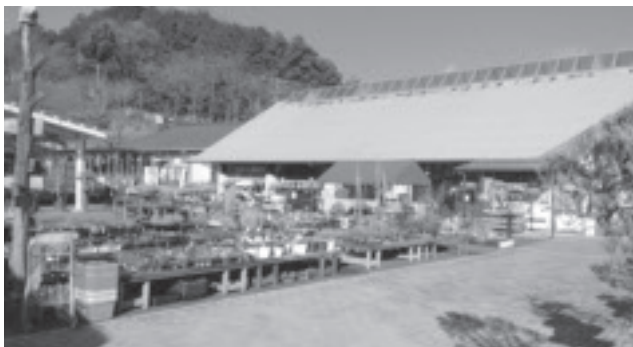
▲鹿沼市花木センター

売り上げ減少の一番の原因は、 来場者数の減少であることは明 白ですので、来場者を増やすこ とが最も重要な課題であると認 識しています。来場者に優しい 施設の配置とするため、現在あ る管理事務所と物産館の入れ替 えをすぐに実施します。また、 売り場に近接した駐車場の増設 やトイレの洋式化、セリ場の塗 装と展示場の増設による直売所 機能の拡充、温室へのカフェ機 能の導入などを検討しているこ ろです。今後、お客様の視 点に立った施設の運営を心がけ、 リピーターの増加を図っていき たいと考えています。