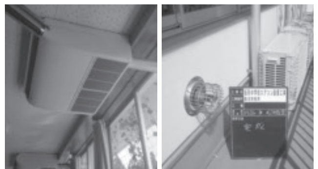
▲エアコン設置工事（板荷中学校）

金額は、学校の規模、電気配線及び設置工事や受変電設備の増設工事費等があり、一律ではありませんが、普通教室で導入した場合、1教室のリース料は平均で年間25万円程度、そこにメンテナンス費用を加算した額になると試算をしています。