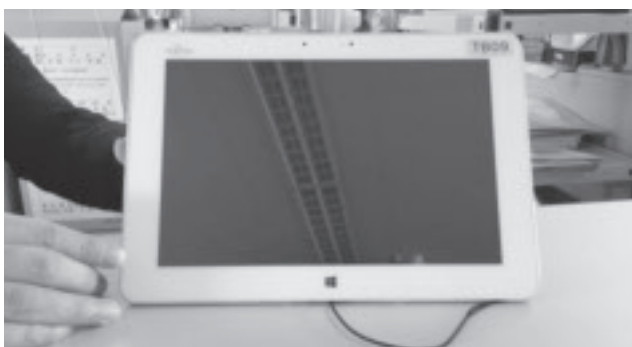
▲モデル校に配置しているものと同型のタブレット

タブレットパソコンは、持ち運びが可能で、キーボードやマウスがなくても操作ができることなど、デスクトップ型のパソコンにはない独自の利点を持っています。タブレットパソコンが配置されている学校からは、キーボードの操作練習や作成した成果物の印刷ができないなどの報告もあるため、今後有用性も検証しながら、機種により児童間の格差が生じないよう早急に周辺機器などの環境整備を進めているところ です。