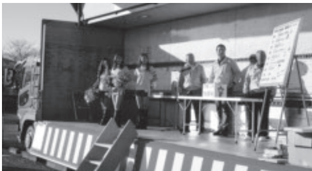
▲東大芦ふれあいフェスタ

活動の取り組みを重ねることで、市民の皆さんも自らの力で地域活性化を進めようという意識が高まってきているものと感じています。今後は、住民の皆さんが課題解決のための事業を選択して推進するため、コミュニティ主体の計画を策定していただき、その予算については、いわゆる地域分権型予算の導入を図りたいと考えています。 産業振興や生活環境整備等を含む、地域振興ビジョンについて、次期総合計画の中で地区の単位を超え、地理的条件等で区分したゾーンごとの方針や施策を位置づけたいと考えています。