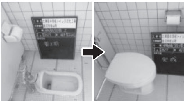
▲和式から洋式への切り替えを進めています。

費の削減は避けて通れないと考えております。この計画により、全ての公共施設について、機能集約等を含めた効果的配置を進めていきたいと考えています。 新庁舎とほかの施設との機能分担等についても、本計画の整理をもとに今後検討していきたいと考えています。平成26年からワーキンググループを設置して検討を始め、平成26年度は維持管理費等を含む現状調査を実施しました。現在、施設を目的別に分類、評価して、今後の対応策を検討しているところです。年度内には計画案をまとめていきたいと考えています。 用率が高いこともあり、施設の長寿命化対策として行う給排水設備の更新にあわせ、和式から洋式への部分的な切り替えだけでなく、トイレブース全体を更新し、洋式トイレへの切り替えを加速していく計画です。 ただし、改築工事や耐震補強及び防災機能強化工事などを除いては、国庫補助事業が不採択となったため、本市でも今年度計画していた北中学校給排水管外改修工事が延期になっています。今後は、栃木県内各市と歩調をあわせ、国に要望を出しながら、予算確保に努め、洋式トイレの設置を進めてまいります。