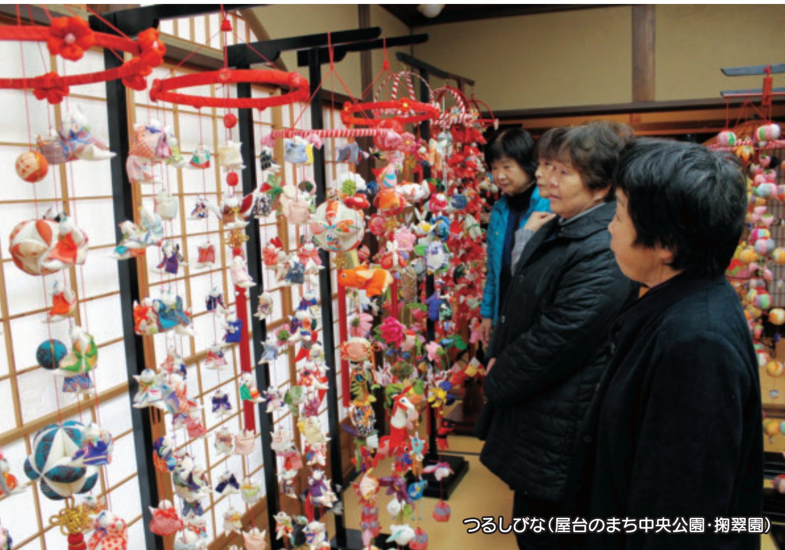
つるしびな(屋台のまち中央公園・掬翠園)