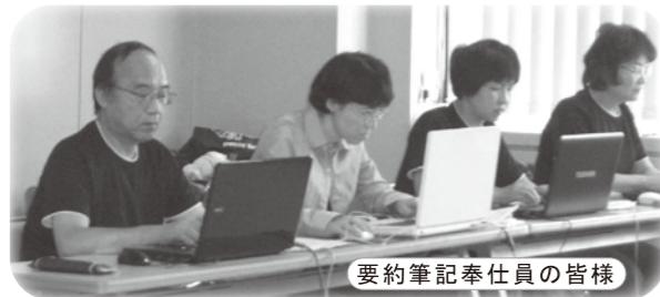
要約筆記奉仕員の皆様