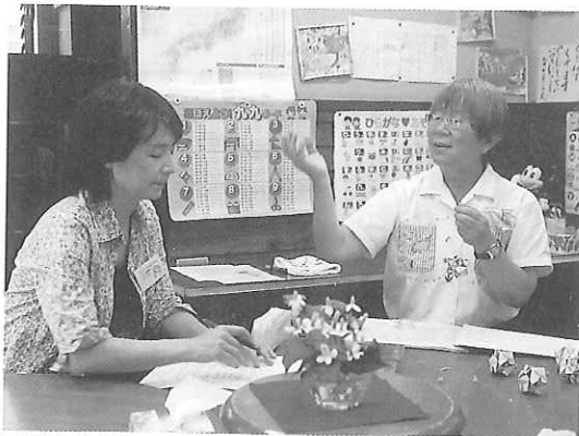
▲輝恵先生にお話を伺う

「たのちゃん！」と子どもたちが次々と寄ってくる様子から先生との深い信頼関係が伝わってきます。「につこりくらぶ」は、家庭的な雰囲気の中でもしっかりと教育を実践している。第二の家といえるのではないのでしょうか。子どもたちの目は生き生きと輝いていました。