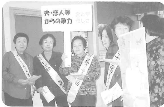
DVをなくそうと集まった皆さん

チラシを配りながら聞いてみました。 DV(ドメスティック・バイオレンス)について、どう思いますか?との問いには、次のような意見が出されました。