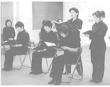
▲劇団の熱演に涙する来場者もありました。

昨日までは夫のために生きてきたけれども今日からは自分の足で人生を歩き出そう 突然の雷雨に打たれても冷たい秋風に枯れ果てても季節がめぐり夏が来ればまたぐんぐんと伸び大輪の花を咲かせる そんなひまわりのように私は生きたい