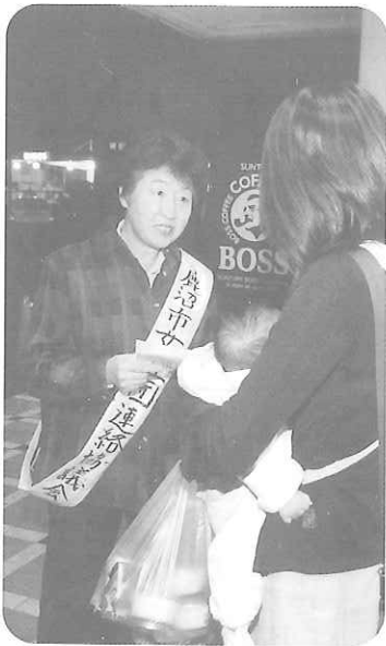
表情からも熱意が伝わる