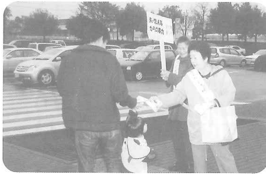
買い物帰りの人たちに真剣に訴える

平成16年11月19日、鹿沼市女性団体連絡協議会(女団連)の約30名が「女性に対する暴力をなくす運動」の啓発活動を展開しました。 この活動は、男性から女性に対する暴力をなくそうと国をあげて取り組んでいるものです。DV(ドメスティック・バイオレンス)の深刻な現状を知った女団連が「私たちも何か出来ることを」と自主的に参加しました。 「女性に対する暴力をなくす運動期間中だけではなく、今後、機会あるごとに呼びかけていきたい」と意欲を燃やしていました。