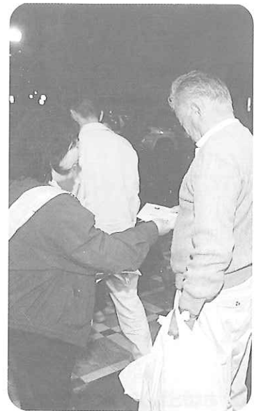
配られたチラシに目をやる男性