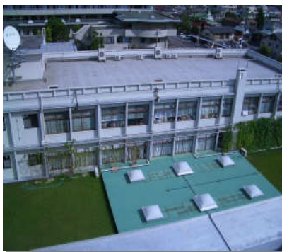
写真：本館・市民ホール

また、庁舎の建設にあたっては、各個別の施設計画において、市民協働の視点に立ち、市民からの部材の提供や協力の受入など、市民の「力」を導入しながら、推進することが求められています。