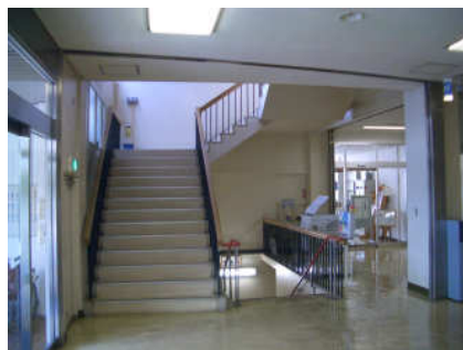
写真：本館ロビーの階段