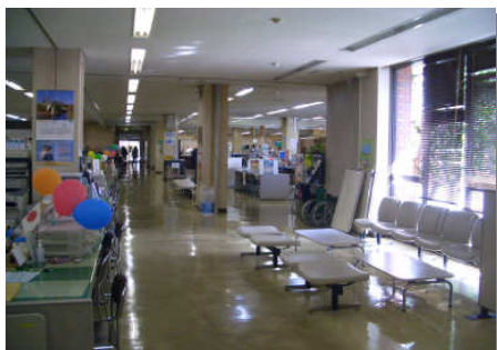
写真：通路に設置された待合