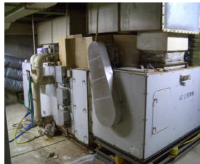
写真：本館地下のボイラー設備

また、消防設備をはじめ、空調、給排水等の各種設備の老朽化が顕著で多額の改修・修繕費用が必要であり、将来的にも維持管理費の増大が懸念されます。