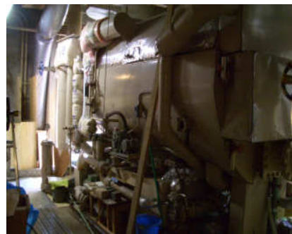
写真：新館1Fのボイラー設備

一部で、グリーンカーテンの設置、LED蛍光灯への転換、電力のピーク時の節電を行っていますが、雨水の再利用、太陽光発電等の新エネルギー・省エネルギー設備への対応は限界であります。