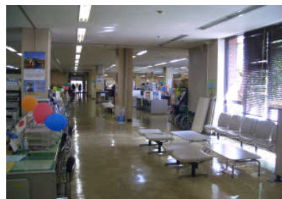
写真：通路に設置された待合

特に、恒常的な駐車スペースの不足及び窓口業務の分散化により、市民サービスの低下を招いています。