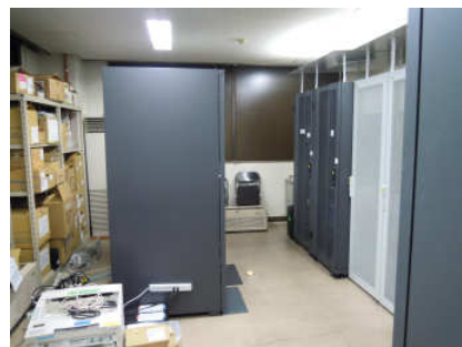
写真:コンピュータサーバ室

今後も更なる高度情報化の進展が予想されるが、情報ネットワーク環境の拡張は困難な状況であり、今後の情報化更なる進展に対応できない状況であります。