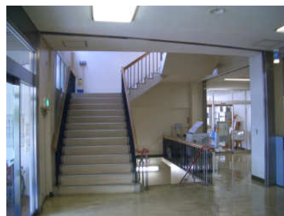
写真：本館ロビーの階段