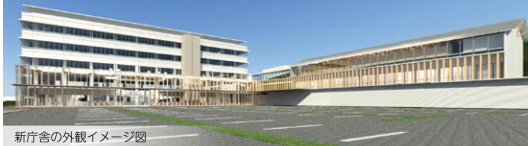
新庁舎の外観イメージ図

市役所現在地に建設される新庁舎の基本設計を作成しました。窓口レイアウトなどの概要をお知らせします。詳細については市ホームページをご覧ください。