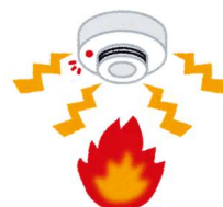
自動火災報知設備