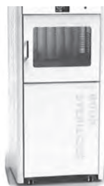
図書消毒機(図書除菌機)