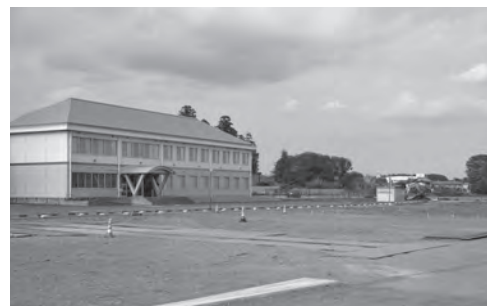
職業訓練センター南側の建設予定地