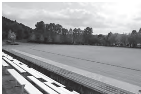
鹿沼運動公園(キョクトウバリースタジアム)の陸上競技場