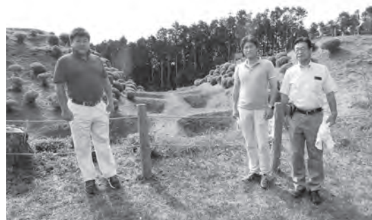
三島市山中城跡の視察

②図書館では、感染症対策を講じた上で、図書等の貸出し、返却のほか、インターネットや電話予約に限った運営を再開しています。図書消毒機は、市民や職員的安全、安心を考慮する観点から、まずは本館に導入していきます。