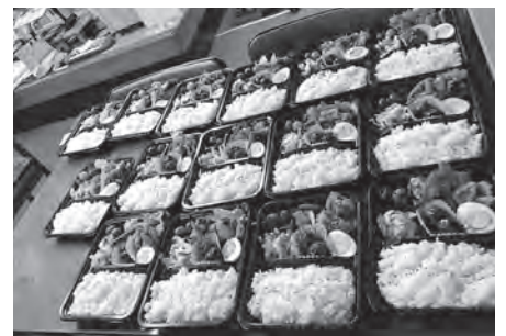
子ども食堂緊急配食支援事業

しているところですが。東部台の「子ども食堂」に伺った際、たまたまコロナの関係で一室に会して食事をするという場面はできなかつた状況でしたが、かわっている皆さんが、生き生きとして役割をこなしている姿を見て、これが、まさに地域で支える一つの典型なのだなと感じました。南押原にもこれからできると伺っていますし、それぞれの地域に、そういった拠点が整備されつつあるということを含め、今後、事業主体についてや運営するにあたって必要とされる専門性などの問題を、しっかりと検証し、できるだけ早く着手できるように、努力をしていきます。