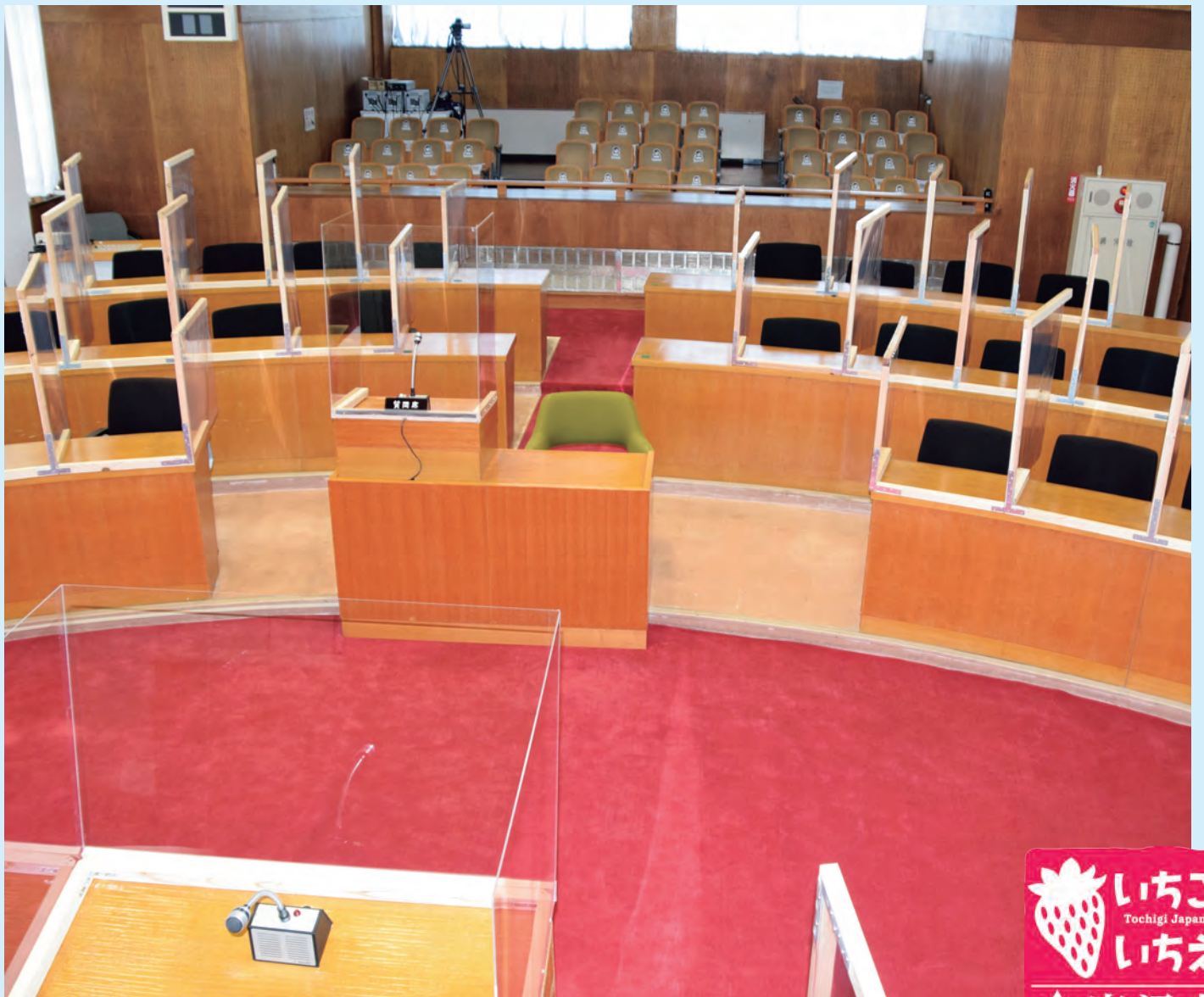
議場に配置した飛沫感染対策の仕切り