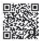
いちご チャレンジ15健康マイレージについて (市ホームページ)

診査やがん検診等の受診率の向上や、各種健康教室への参加者の増加を図り、市民の健康寿命の延伸を図ることを目的としており、20歳以上の市民を対象に、令和元年度からスタートしました。令和元年度は、500人の参加者を目標としましたが、実際の応募者は136人とどまりました。令和2年度は、昨年度の課題を改善して、多くの市民が参加できる事業とするため、健康診査やがん検診、健康教室等の会場で積極的に事業を周知するとともに、5ポイントを獲得できる事業を増やすなど、市民が事業に取り組みやすいよう改善し、事業を推進します。