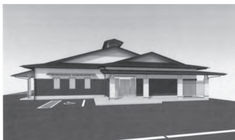
イメージ図（西側から）

建物の工事は令和3年3月末までに完了する予定で、その後、外構工事を行い、令和3年12月に供用を開始する予定です。