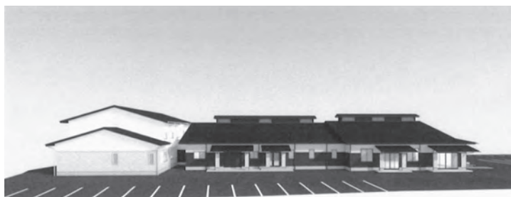
イメージ図（北側から）