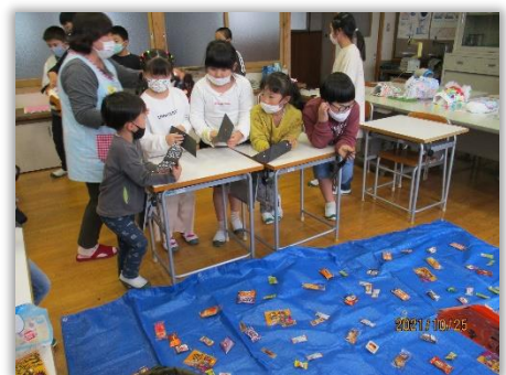
放課後子どもスクール