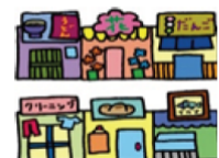
地域学校協働活動