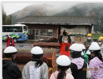
地元の方が講師となって行う地域の森林学習