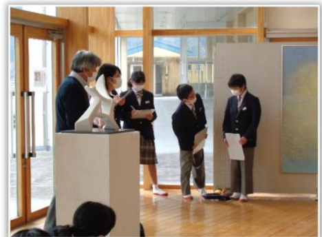
「AWANO夢咲くフェス」で画家本人と絵画の鑑賞授業をする中学生