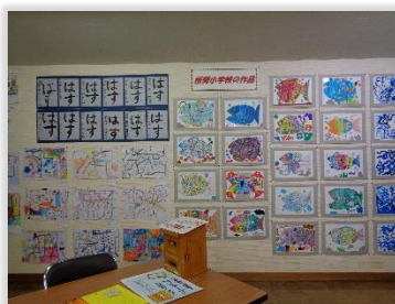
地区の文化祭で、公民館に子供たちの作品を展示