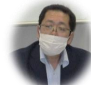
鹿沼警察 久郷係長