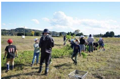
小学生と共同で行った 人参の収穫

コロナ禍という事態を受け、当初の想定された取り組みが難しくなっていました。そこで、目的に沿った内容で事業に取り組んでいくにはどうすべきか検討し、2020 年からは南摩中学校との共同事業「里山百手プロジェクト」を始めました。このプロジェクトでは、児童生徒と一緒に農作業をし、収穫物を給食で食べてもらった他、給食に使えない B 品野菜を加工して加工品や、加工品のパッケージのデザインをみんなでつくったり、その販売方法をマーケティング理論に基づいて考察したり、と、普段の学校生活ではなかなか触れられない分野の学びの機会を、それまでの活動があったからこそできる形で提供することができたと考えています。この取り組みは下野新聞に複数回掲載された他、来年度開催の関東甲信越地区中学校長会 第 74 回研究協議会埼玉大会にて、上都賀地区の代表事例として紹介される予定であり、地域の PR にもつながったと思います。