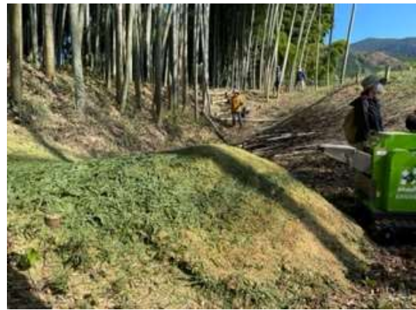
下久我地内の耕作放棄地の再生（令和3年度）