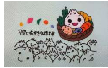
南摩小、上南摩小児童と一緒に考えたランチマット挿絵

今後はこの会議を中心に、地域の各組織と連携しながら地域の課題に取り組んでいきます。