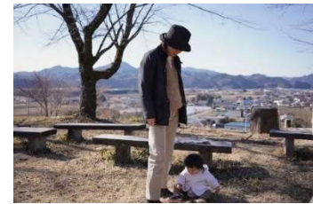
なんまんフォトコンテスト 最優秀作品