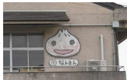
なんまんタイル壁画