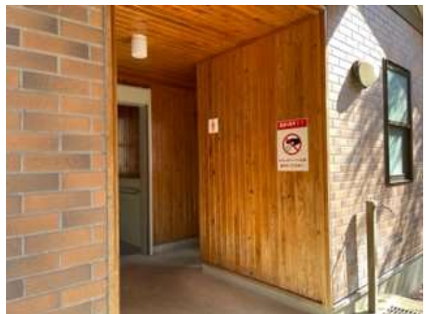
加蘇山神社トイレ(外観)