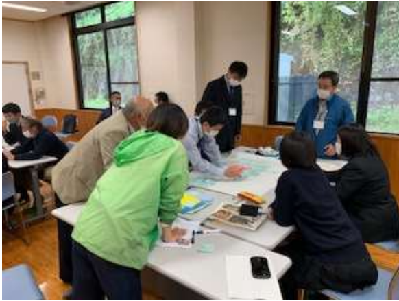
「ふるさと発見グリーン・ツーリズム入門塾」に参加

当初は交流人口増を目指し、パンフレット作成、イベント開催を計画していましたが、コロナウィルス感染症拡大のため事業の中止、大幅な変更を余儀なくされました。事業の実施団体である加蘇地区ふるさとづくり協議会は、事業の中止期間を活動のブラッシュアップ期間ととらえアフターコロナを見据えた観光PR事業を模索することになりました。