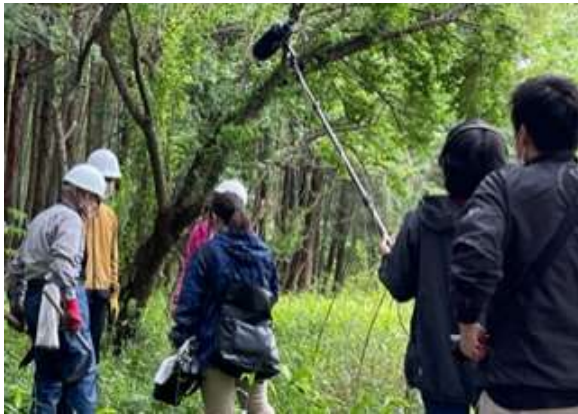
とちぎ農村QUEST動画作成

このような活動を通し、会員の間では地区の豊かな自然の中での里山保全活動や農作業体験に価値を見出し、都市住民との交流や地域活性化に繋げることができないか方策を探る動きが始まっています。当地区はいわゆる目玉となる観光資源が乏しく、観光スポットを周遊したり、グルメを提供する一般的な観光にはあまり適していません。今後は単に一過性のイベントを企画するのではなく、参加者や関係者とのつながりを重視し、当地区のファンになってもらい継続的な交流を生み出す活動を展開したいと考えています。