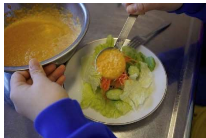
中学生と共同で行った B 品野菜 (人参)を使ったドレッシングづくり