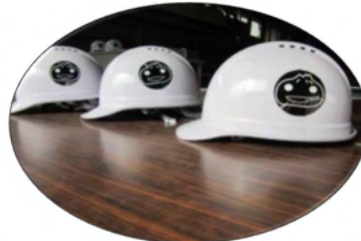
なんまんヘルメット