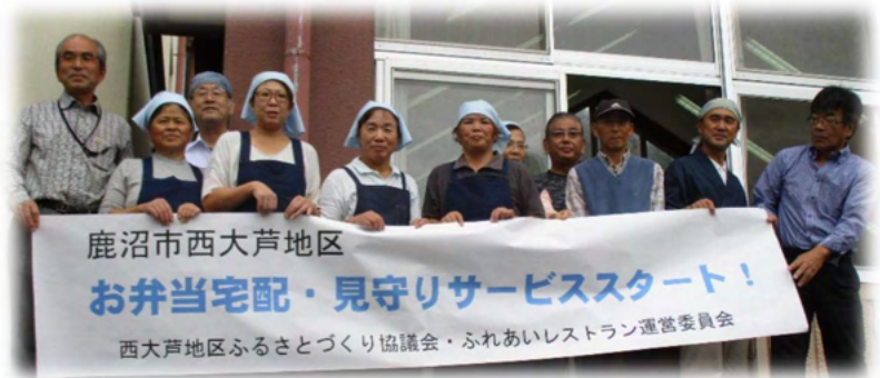
お弁当と思いやりを届けます