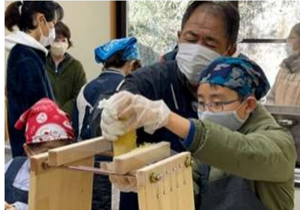
干し芋づくりイベント