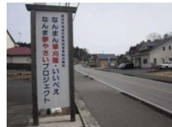
地域の夢事業拠点施設前にある看板