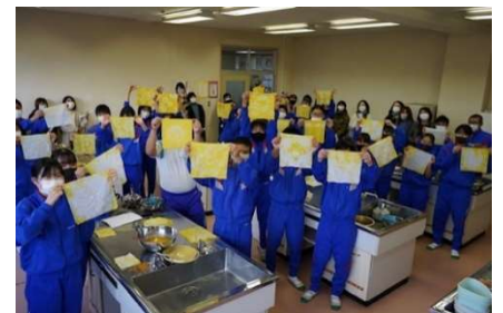
中学生と共同で行った 玉ねぎの皮を使った草木染