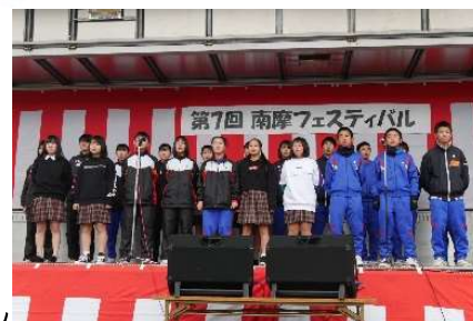
南摩フェスティバル

しかしながらコロナ禍以降、各種お祭りなどの大勢集まるイベントが中止となりました。そのため、南摩中学校生徒達が考えたなんまんタイル壁画やなんまんイルミネーションの設置、南摩小学校と上南摩小学校児童達が共同でデザインしたランチマットの作成・配布。また、南摩フェスティバル代替え事業で