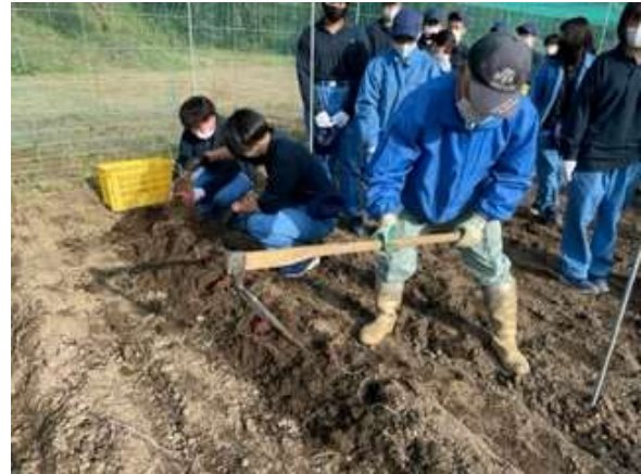
鹿沼南高校のサツマイモの収穫実習に協力