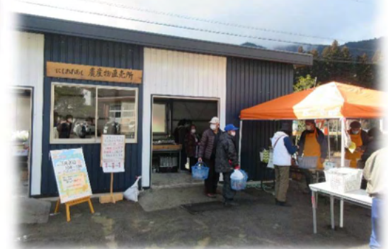
地域の思いが詰まった新しい直売所