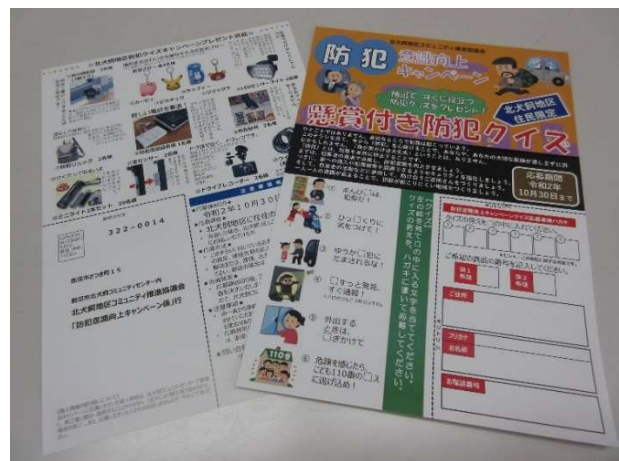
↑防犯クイズキャンペーンチラシ ↖通学路等での交通安全街頭啓発活動 ←ベスト・交通安全啓発看板