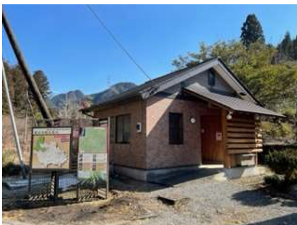
加蘇山神社トイレ(外観)

現在、加蘇地区ふるさとづくり協議会のメンバーが定期的に清掃、消耗品の補充、マナーポスターの掲示、トイレ周辺の除草等を行っています。またトイレと隣接し観光案内、周辺地図の看板が設置されており石裂山観光の拠点として今後も維持管理を継続していきます。