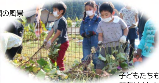
子どもたちも頑張りました