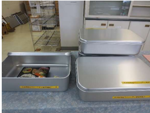
購入したアルミ飯缶

また、地区福祉活動推進協議会が行っている「にこにこ弁当事業」においては、アルミ飯缶を購入することにより、一人暮らしなどの高齢者に衛生的にお弁当配達し、安否確認や交流を行うことにより地域の助け合いをより高めました。