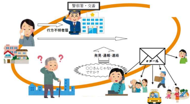
「地域を守る絆の会」のイメージ図

地域資源活用事業については、里山林整備事業として、「津田の里山を育てる会」を組織し、購入した自走式草刈り機やウィンチ、コンテナなどを活用しながら、約2.8ヘクタールの荒れた山林の再生に取り組んでいます。「後世によい里山を引き継ぐため、がんばっていきたい。」などの声もあり、子ども達の郷土愛が育ち、地域の人々の憩いの場となるような里山として活用することを目指しています。