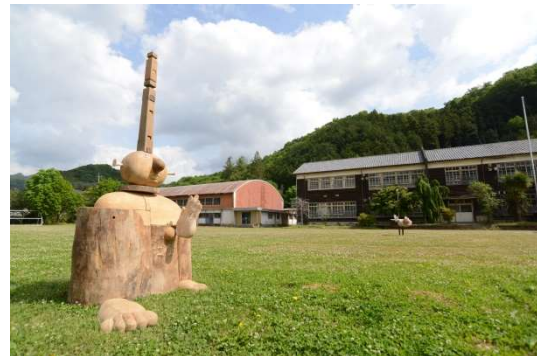
メイン会場の旧粟野中学校

地域とともにある学校づくりを事業テーマとして継続してきた活動を通して、多くの成果を確認することができる。少子化、高齢化が進行している時代だからこそ、故郷の良さや地域住民の協力、人の繋がりが心豊かな生活の土台となり、地域文化を高め人生を楽しくしていくために必要な事であることを認識することができる。