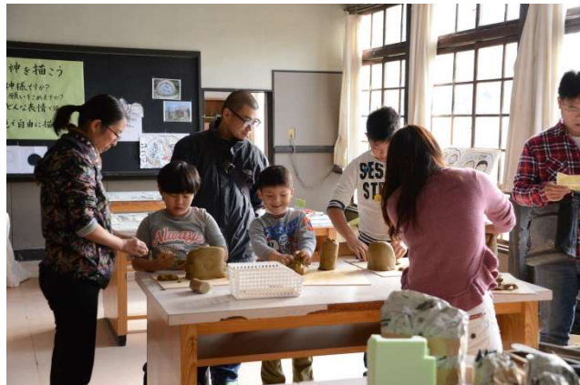
道祖神ワークショップ

粕尾地区にある鹿沼市指定の文化財である双体道祖神を粟野地域の文化の象徴として考え、地域の方々、特に子ども達が知るきっかけとなるようなテーマにしている。