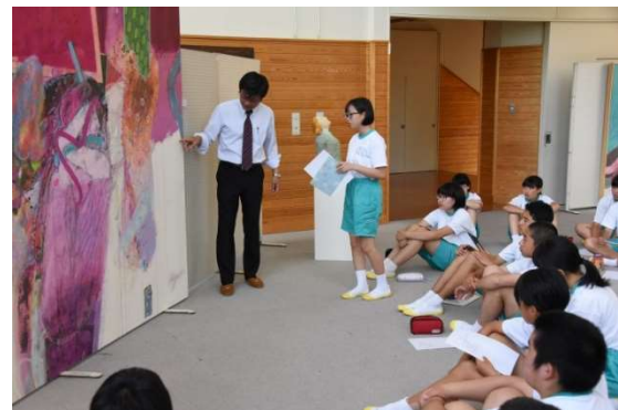
粟野中学校での鑑賞授業

粟野中学校での展覧会では、必ず作家を交えて24回の公開鑑賞授業を行った。作品を制作した作家に直に聞くことができ、作品の本質に迫ることができた。作家の生き方や作品への思いや表現に対するこだわりなど、生徒達は食い入るように話を聞いていた。豊かな感性を培う大切な時間となった。