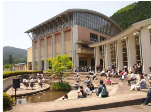
粟野中学校での音楽会

令和元年の秋から、「AWANO夢咲くART FESTIVAL」と名前を変えたが、台風19号による被害を受け中止した。そして、令和2年は、新型コロナウイルス感染症拡大防止のために中止した。令和3年の春から、展覧会のみで再開した。そして、秋には、会場を医王寺常楽寺を加えて4会場とした。