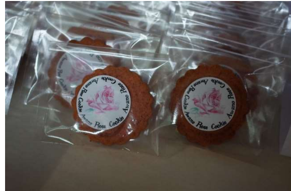
手作りラベルのローズクッキー

地元の洋菓子店との連携によって、粟野中学校のバラ園から発想を得て、ローズクッキーの開発と販売ができた。フェスティバル期間中や地域の方が集まる時に販売している。袋に貼るシールと箱に巻く帯のデザインを粟野中学校生徒が行った。地元や来客に定着しつつある。