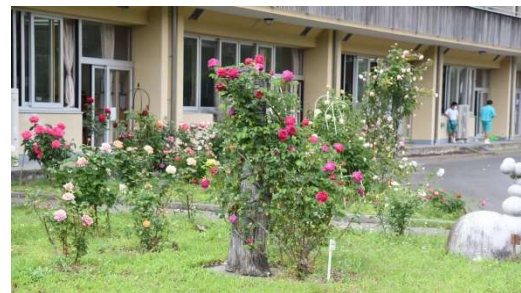
粟野中学校のバラ園

粟野中学校に80本のバラを植えバラ園をつくり管理している。バラ育成管理ボランティアを組織し、定期的な選定や消毒、除草を行っている。地域のボランティアの協力があって維持されてきた。美しいバラが咲く時期に合わせて展覧会を実施してきた。