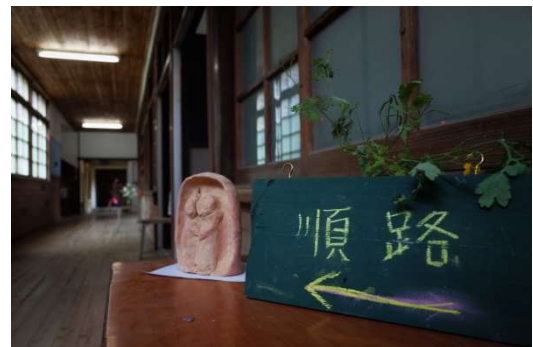
目指す方向に向かって

学校教育において、体験活動や交流活動、地域学習やキャリア教育、芸術活動などに地域が関わる事が必要ではないでしょうか。