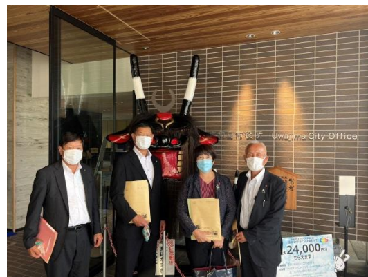
視察先の状況写真