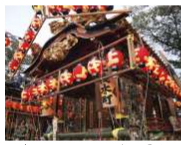
今年の当番町上村木町屋台

4年ぶりの開催（10月8日、9日）に向けて、準備を進めていましたが、新型コロナウイルス感染拡大防止のため、今年も中止としました。