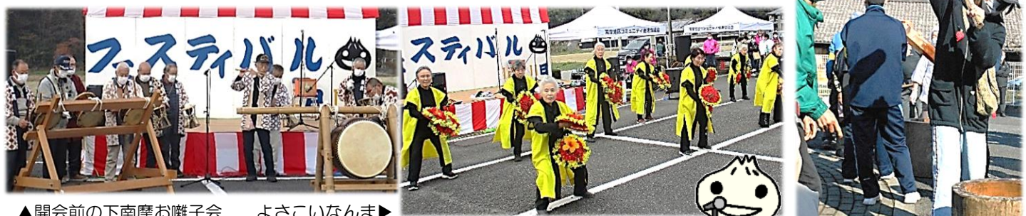
▲開会前の下南摩お囃子会 よさこいなんま