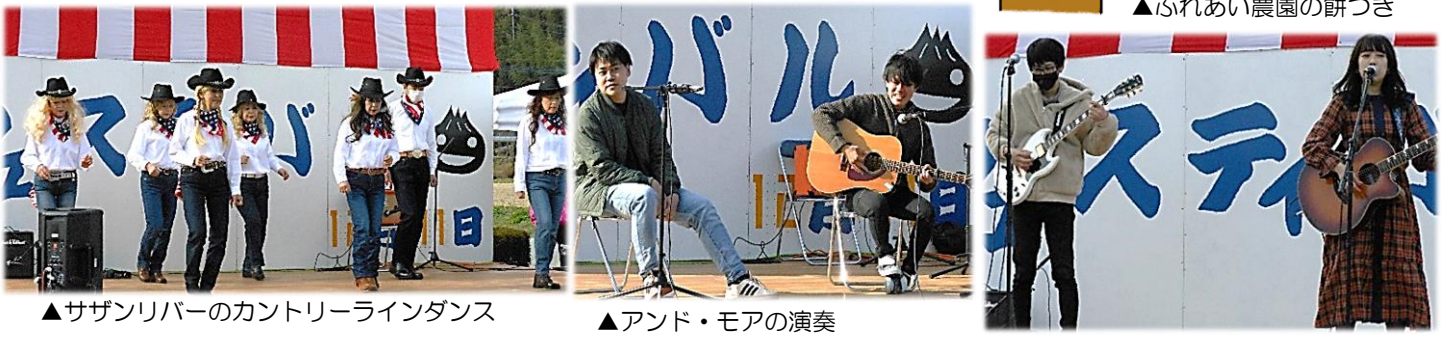
▲サザンリバーのカントリーラインダンス