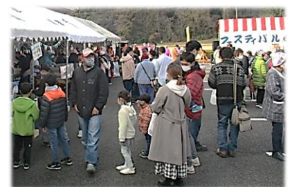
▲530人ほどが来てくれました

残念ながら当日来れなかった人も、たくさんの写真から楽しそうな雰囲気を感じ取っていただければと思います。