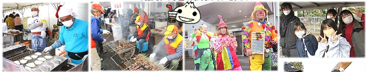
▲なんまん焼き、猟友会の串焼きなど9店が出店しました!