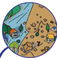
土砂災害 警戒情報