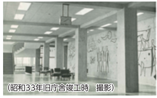
（昭和33年旧庁舎竣工時 撮影）