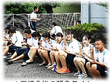
▲田植え後の軽食タイム

米作りの体験ができる学校も少ないので、地域の方の協力のもとこのような体験学習ができるのは、南摩中ならではのかもしれませんね。