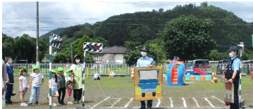
栗野保育園ニュース