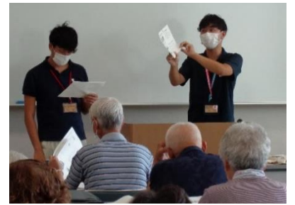
▲ゴミ分別の説明に聞き入りました

現在の分別内容については、市広報令和5年8月号に、分別収集カレンダーが載っていますので参考にしてください。