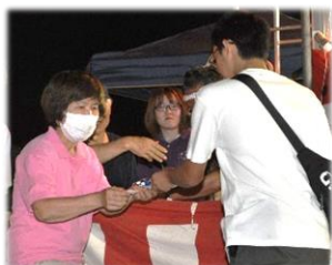
抽選会 賞品は何か?