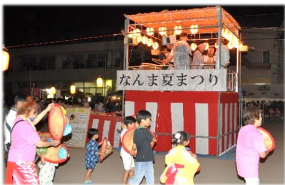
▲お囃子に合わせて楽しく踊りました

焼きそばやかき氷などのお祭り定番の出店もあり、踊りはもちろん豪華賞品が当たる抽選会も盛り上がりました。