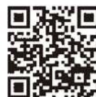
認証キーの取得方法 発注者への提出方法