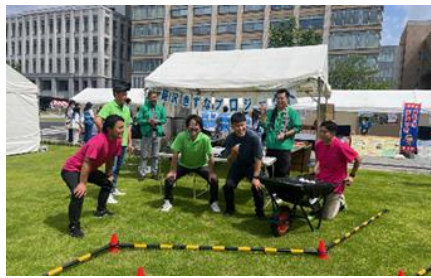
【菊沢きずなプロジェクト実行委員会】 地域の防災意識向上のための 防災啓発強化事業