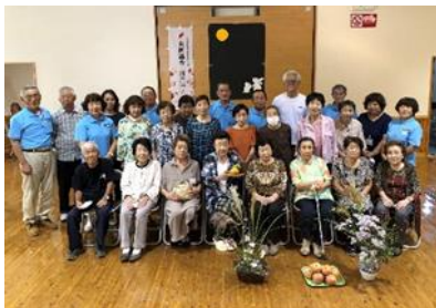
【さくさわスマイル号実行委員会】 運転ボランティアと 利用者のための交流会事業