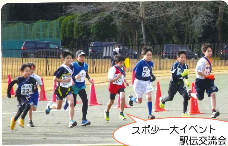
スポ少一大イベント 駅伝交流会