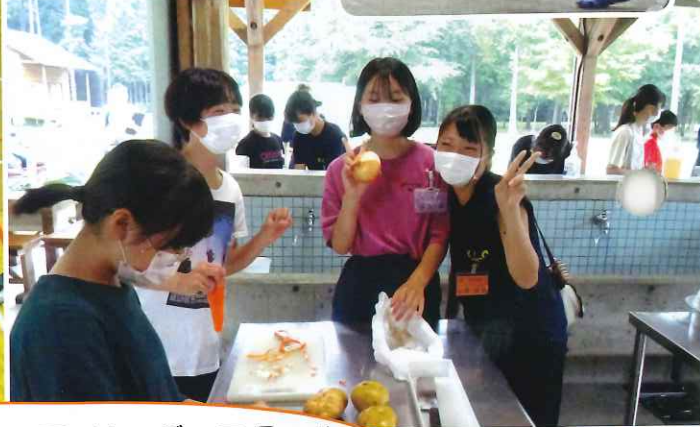
ジュニア・リーダースクール 兼交歓会 子供は楽しく!